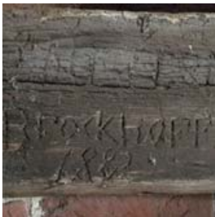
Kirche Zirchow, innen